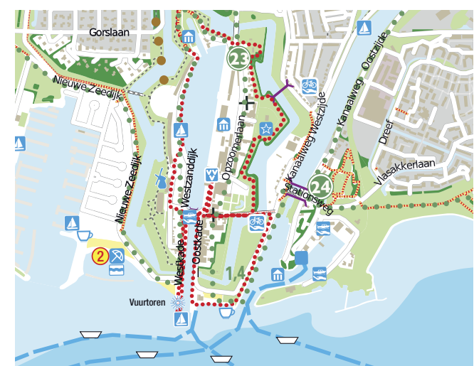
Detailkaart Vesting Hellevoetsluis