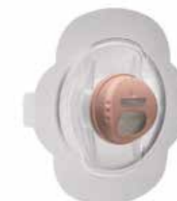
Provox FreeHands FlexiVoice in combinatie met StabiliBase pleister