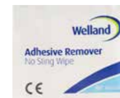
Remove doekje, WAD50