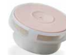
Provox Xtra HME-cassette