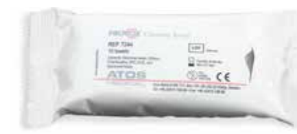
Provox Cleaning Towels, artikel 7244