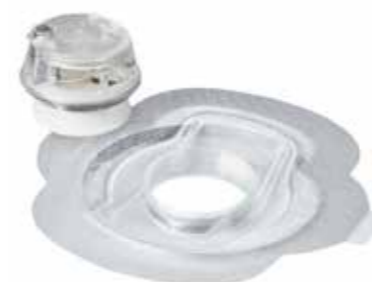
Provox FreeHands HME-cassette in combinatie met een Provox StabiliBase pleister

Wacht tenminste 30 minuten voordat u de Provox FreeHands HME-cassette of de Provox FreeHands FlexiVoice op de stomapleister plaatst. Gebruikt u de Provox XtraMoist of XtraFlow HME-cassette? Wacht dan 5 minuten voor u deze aanbrengt.