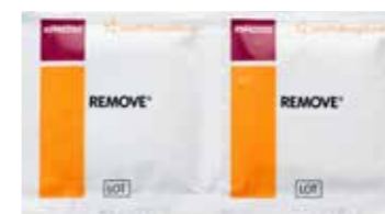
Remove doekje, artnr. 59403125

Om de pleister veilig te verwijderen zonder de huid te beschadigen, kunt u een Remove doekje gebruiken. Dit doekje is doordrenkt met een vloeistof die de lijmlaag van de pleister oplost, zodat de pleister makkelijk loslaat. Dit doekje bevat huidvriendelijke oliën.